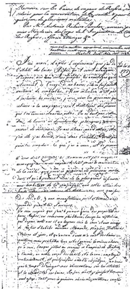
Manuscrito de Ribeiro Sanches (fac - simile)

Quanto a esta curiosa propriedade, Francisco Tavares nega-a: "Ou foi ilusão de sentidos, ou perdeu-se de tal maneira esta curiosa propriedade, que apenas restão della memórias despojadas de segura continuada observação, e somente lhe asseverada na fé de quem a escrevêra" (7) . Em contrapartida dá-nos uma descrição mais real das referidas Caldas: "Da sua nascente he conduzida a agua por hum cano que na falda da Serra termina n'hum tanque fabricado dentro d'huma pequena caza de abobada, a qual por mui vaga